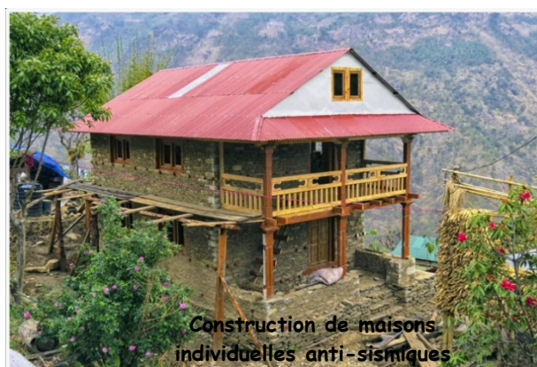
Construction de maisons individuelles anti-sismiques