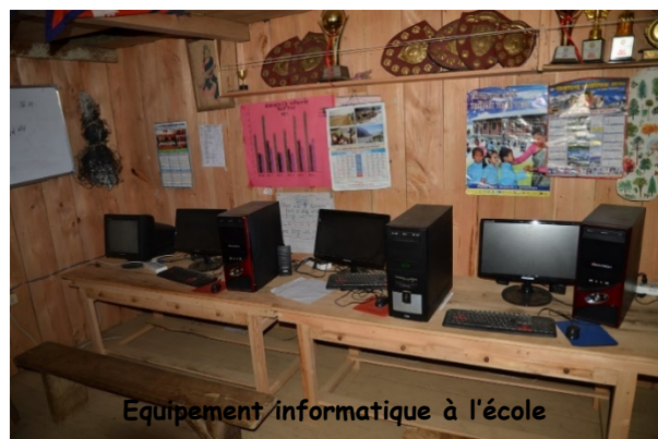
Équipement informatique à l'école