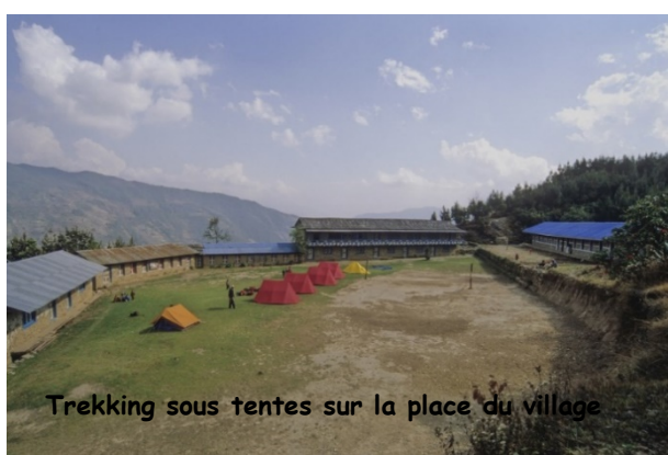
Trekking sous tentes sur la place du village

A l'issu du voyage, un reçu fiscal sera fourni à chaque participant lui permettant d'obtenir une réduction d'impôts de 65% du montant de sa part solidaire distribuée.