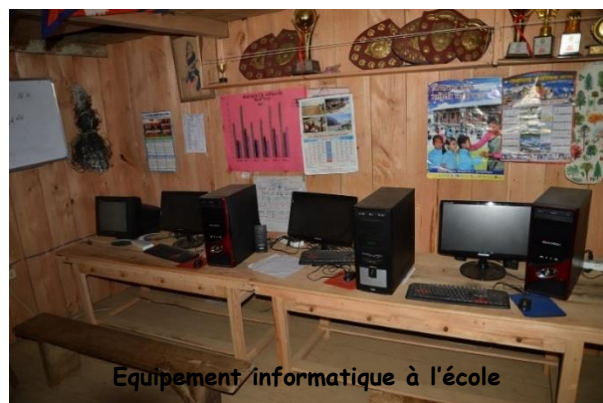
Equipeement informatique à l'école