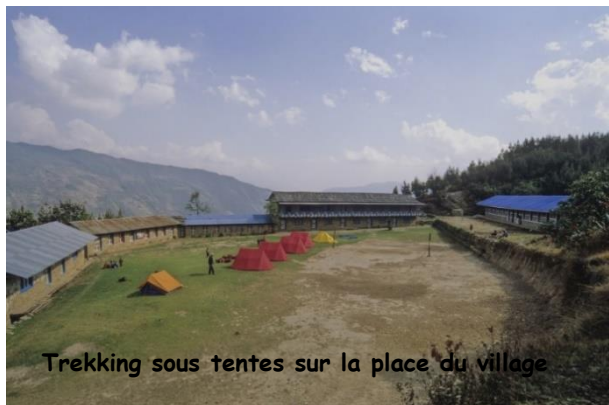
Trekking sous tentes sur la place du village